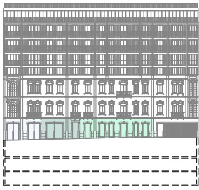
FACHADA PRINCIPAL MAIN FACADE